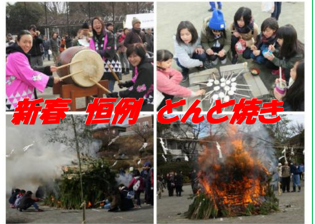
新春恒例 どんど焼き

甘酒・豚汁にグラウンドを半周する長い行列ができ、かまどではお団子を焼く子どもたちの賑やかな楽しい声が弾み、暖かな日差しの中で楽しいひと時を過ごしました。近隣の皆様のご理解と社協・自治会役員の皆様のご協力に厚く感謝いたします。